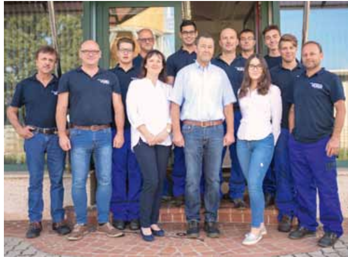
Das erfolgreiche Team von ULRICH Maschinenbau

Für die gute Zusammenarbeit und für die Treue in den vergangenen 30 Jahren möchte die Geschäftsleitung allen Mitarbeitern, Kunden, Lieferanten und Freunden ein herzliches DANKE sagen. ■