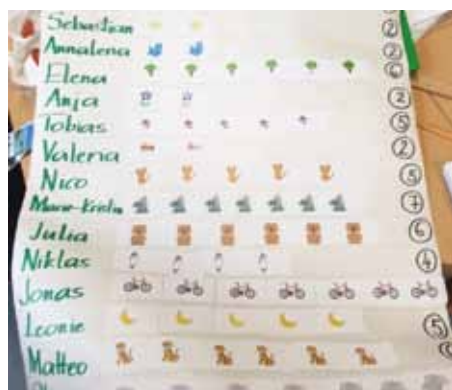
Aktion zur Sammlung von Fitness-Punkten für Zufußgehen in der Volksschule St. Nikolai ob Draßling

KONTAKT, INFO & VERFASSER: KEM Grünes Band Südsteiermark, Modellregions-Manager DI Christian Luttenberger, Energieregion Oststeiermark GmbH, +43 (0)676/78 400 86, christian.luttenberger@erom.at, www.erom.at, www.bit.ly/KEM_GBS, www.mureck.gv.at/klima-und-energiemodellregion-gruenes-band-suedsteiermark Energieagentur Weststeiermark im KEM-Büro im Au(s)blicke Haus in Misselsdorf 154, 8480 Gosdorf, 03462 23 289, www.energie-agentur.at/