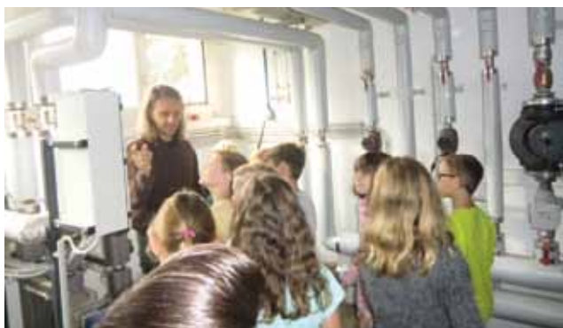
Besichtigung und Erklärung Heizungssystem in der Volksschule Lichendorf