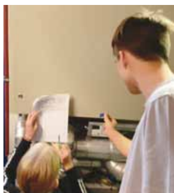
Ablesung des Wärmemengen-Zählers für die Energiebuchhaltung in der HLW Mureck