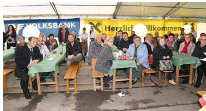
Das 20-Jahr-Jubiläum wurde von der Nahwärme Mureck GmbH mit vielen ihrer Kunden gefeiert.