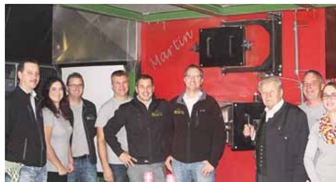
Das Team der Nahwärme Mureck – sie sind 365 Tage im Jahr, 24 Stunden am Tag für die Nahwärmekunden erreichbar.