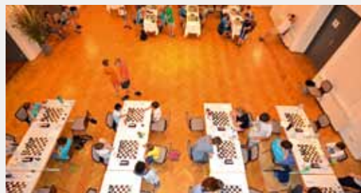
Turniersaal Internationales Steirisches Open