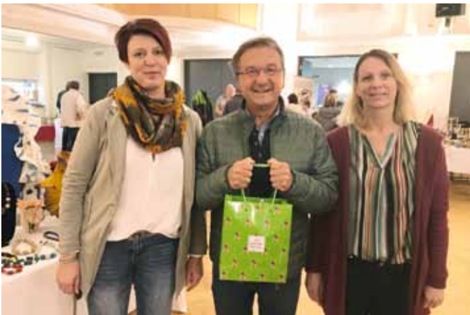
Die Weihnachtsausstellung der Hobbykünstler am 17./18. November 2018 im Kulturzentrum Mureck war ein voller Erfolg.

Kürzlich fand eine Exkursion der River'Scool an der Muraufweitung Gosdorf statt. Dabei konnten die positiven Auswirkungen der Renaturierungsmaßnahmen an der Mur für Mensch und Natur aufgezeigt werden. An der Führung nahmen auch Vertreterinnen des Tourismusverbands teil.