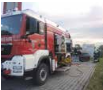
2020 Übung mit hydraulischen Rettungsgeräten im Rüsthaushof