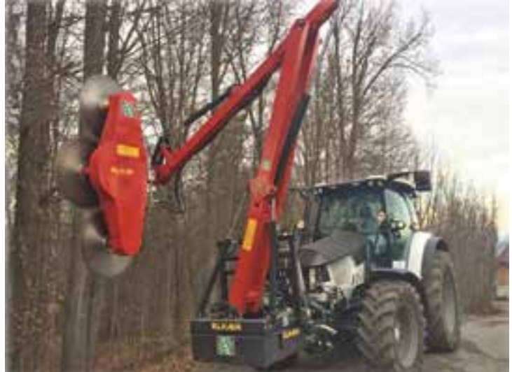
Äste und Hecken mühelos schneiden