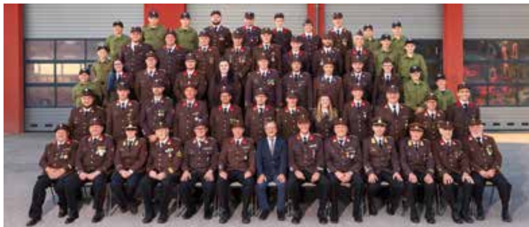
2021 – Mannschaftsfoto 150 Jahre FF Mureck