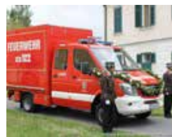
2015 – Segnung des neuen LKW-A am Florianisonntag