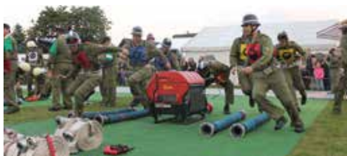
2016 Bewerbungsgruppe beim Bereichsleistungsbewerb in Eichfeld