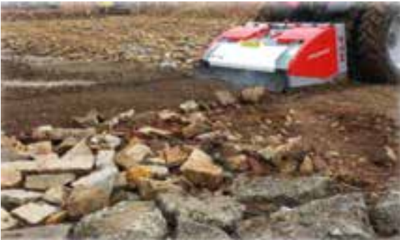
Steine werden zertrümmert – erspart mühsames Steine sammeln.