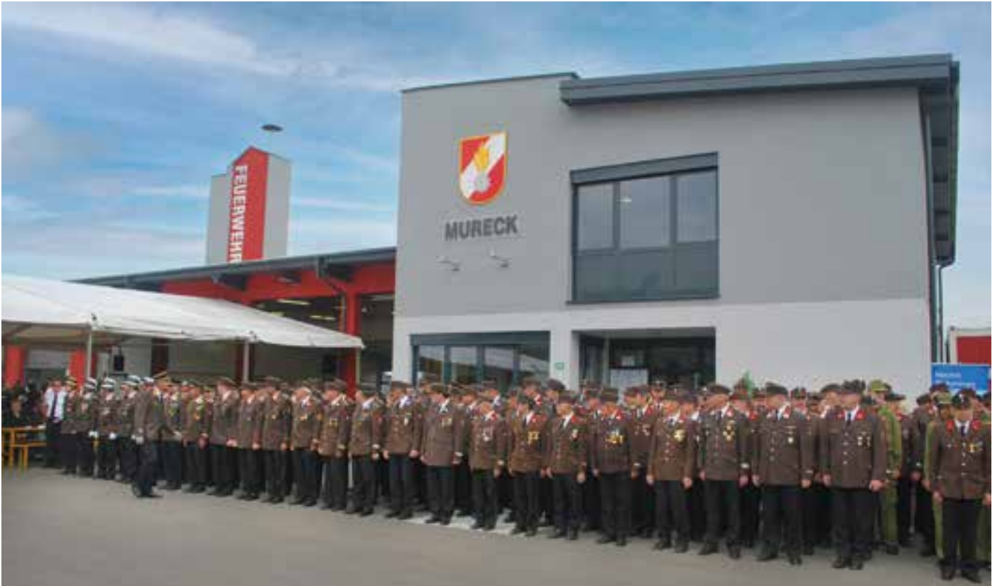
2010 – Eröffnung des neuerrichteten Feuerwehrhauses

lung des Funknetzes vom bisherigen Analogsystem im 4-m-Band auf die BOS-Digitalfunkschiene wird im gesamten steirischen Feuerwehrwesen ein Meilenstein für die Kommunikation gesetzt.