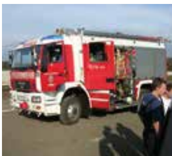
2005 Brandeinsatz in Weitersfeld mit damals neuem TLF 2000