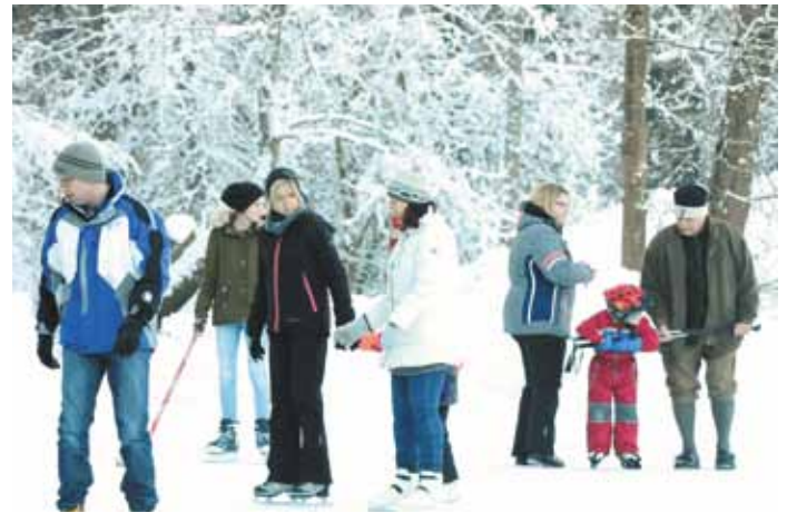
...und unser Eislaufplatz sind gut besucht.