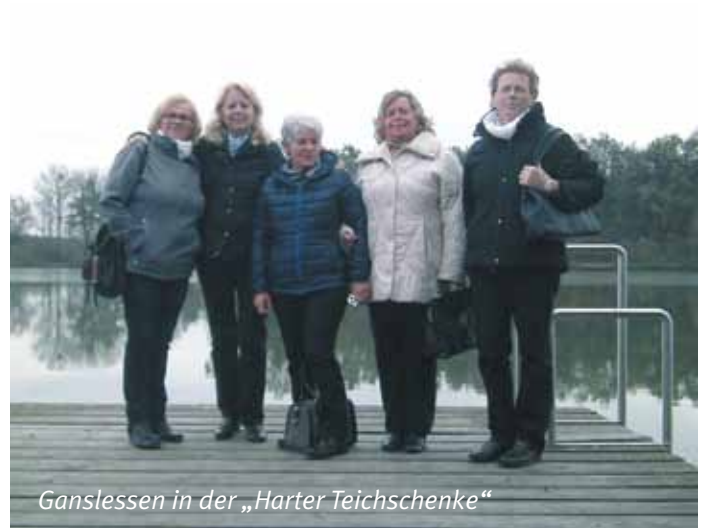
Ganslessen in der „Harter Teichschenke“