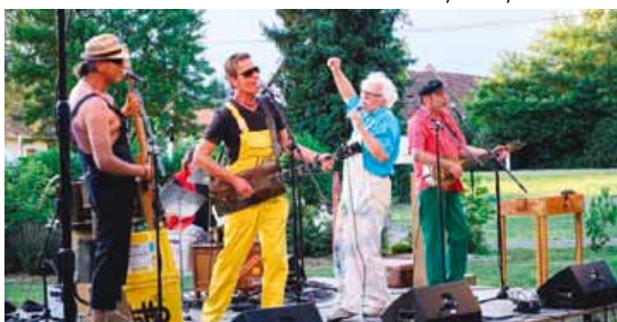
Konzert Blechbixnbänd im Dorfpark in Lichendorf