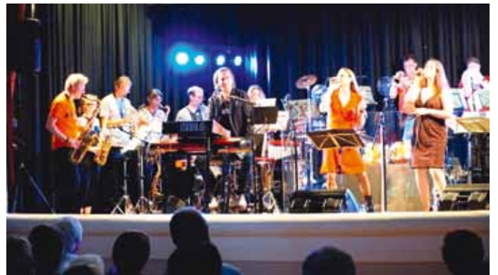
Konzert im Kulturzentrum mit der Bigband Gleichenberg feat. Maalo