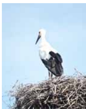
Das Eichfelder Einzelkind