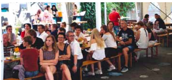
Konzert WeekendSounds im JuZ