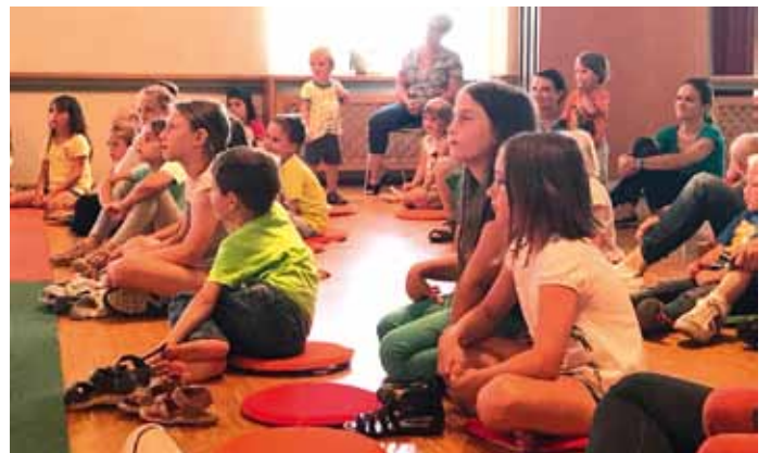
MusicAct-Froschkonzert im Kultursaal Weinburg