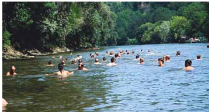
Big Jump bei der Murfähre in Weitersfeld