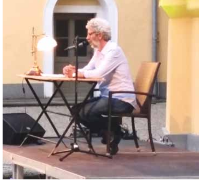
Dirk Stermann liest aus seinem Buch „Der Junge bekommt das Gute zuletzt.“