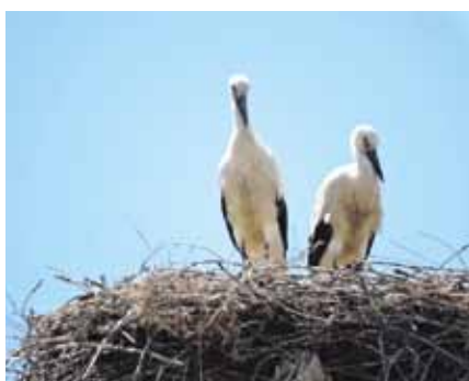
Die Murecker Zwillinge