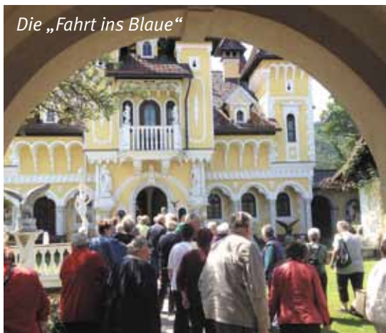
Die „Fahrt ins Blaue“

halten werden konnte. Bedingt dadurch entstanden längere Wartezeiten auf das Essen, wofür wir dann jedoch durch die gute Qualität der Speisen mehr als entschädigt wurden. Am Spätnachmittag ging es per Seilbahn wieder ins Tal zum Bus, der uns sicher nach Gosdorf in „Erika's Stüberl“ brachte, wo wir unseren schönen Ausflug bei einer guten Jause ausklingen ließen.