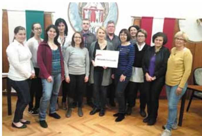
MitarbeiterInnen des engagierten Teams der Gesunden Gemeinde der Stadtgemeinde Mureck

Unser Arbeitskreis der Gesunden Gemeinde Mureck ist offen für interessierte GemeindebürgerInnen. Nehmen Sie Kontakt mit uns auf! Wir freuen uns über jede Art von Unterstützung. ■