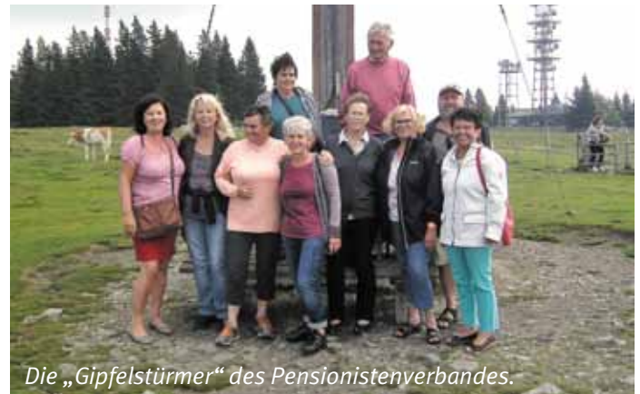
Die „Gipfelstürmer“ des Pensionistenverbandes.

Am 15. September 2016 setzten 45 Mitglieder der OG Gosdorf und Gäste der OG Mureck bei schönem Wetter zum Gipfelsturm auf den Grazer Hausberg, dem Schöckl an. Zuerst ging es per Bus in den Luftkurort St. Radegund, wo sich die Talstation der Schöckl-Seilbahn befindet, mit deren Hilfe innerhalb von sieben Minuten das Hochplateau erklimmen wurde. Bevor es zum Mittagessen ging, nutzten mehrere Teilnehmer die Zeit zu einem gemütlichen Spaziergang, um die Umgebung zu erkunden. Einige Unentwegte marschierten zum Gipfelkreuz, vorbei an weidenden Kühen. Das Hauptaugenmerk war hier auf die schöne Aussicht sowie die zahllosen Kuhfladen am Weg gerichtet. Durch die gute Ber-