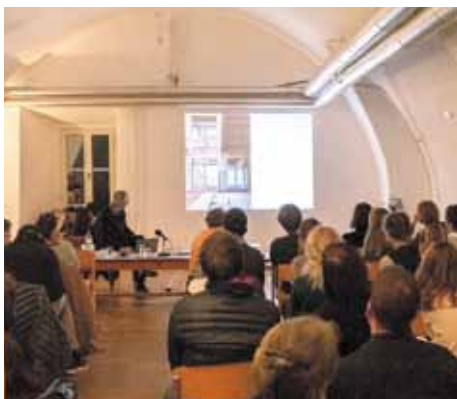
Präsentation eigener Arbeiten durch die eingeladenen, international bekannten Architekten während des Symposiums. Im Bild Jan de Vylder.