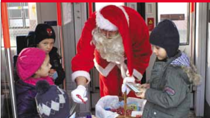
Samstag, 24. Dezember 2016