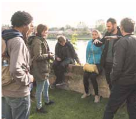
Besuch von Referenzprojekten bei der Exkursion durch die štajerska. Hier die Führung durch das Minoritenkloster in Ptuj.