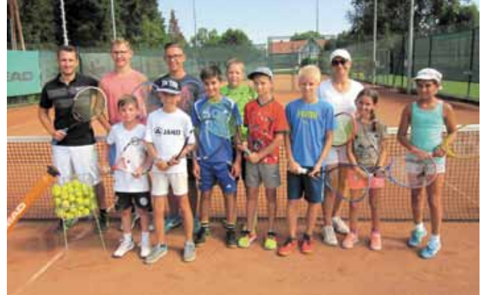
Gratis Kinderkurs – 13 Kinder haben das Angebot des TC Eichfeld für einen Gratistenniskurs angenommen und waren mit Begeisterung dabei.