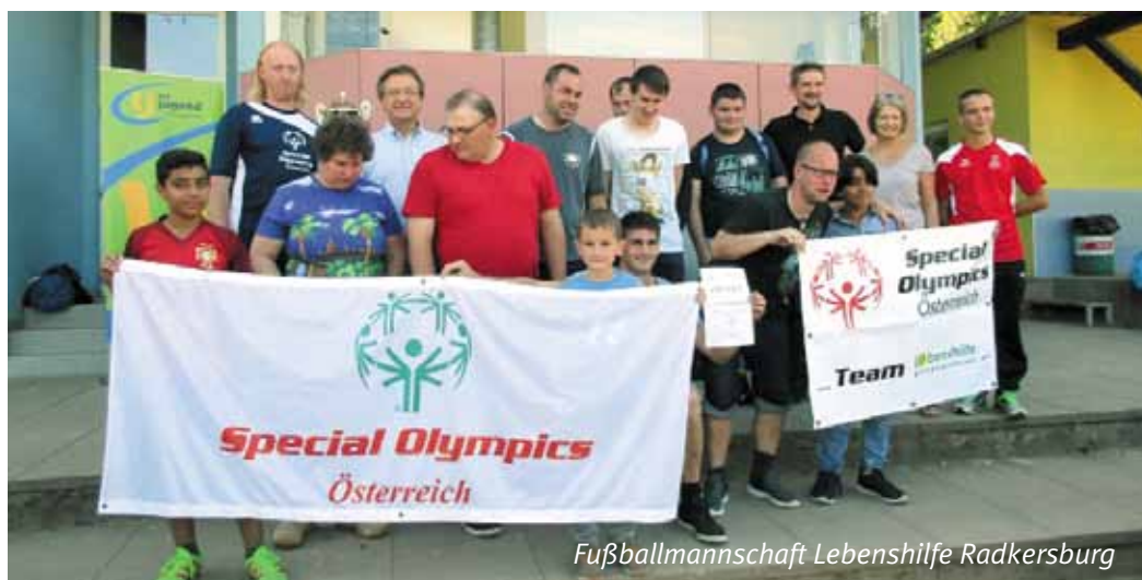
Fußballmannschaft Lebenshilfe Radkersburg