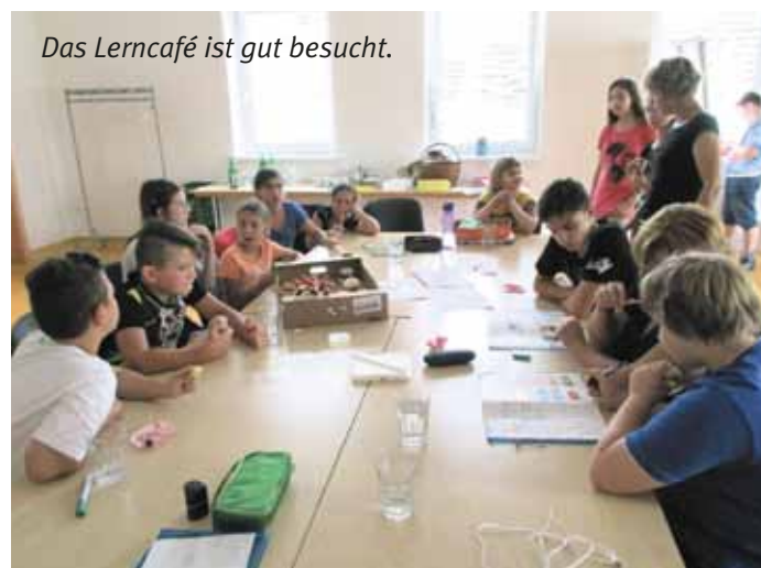
Das Lerncafé ist gut besucht.

Für Kinder mit besonderen Bedürfnissen und deren Bezugspersonen kann die Schule oder der Kindergarten eine große Herausforderung sein. Doch durch das bewusste Hinschauen und Hinhören öffnen