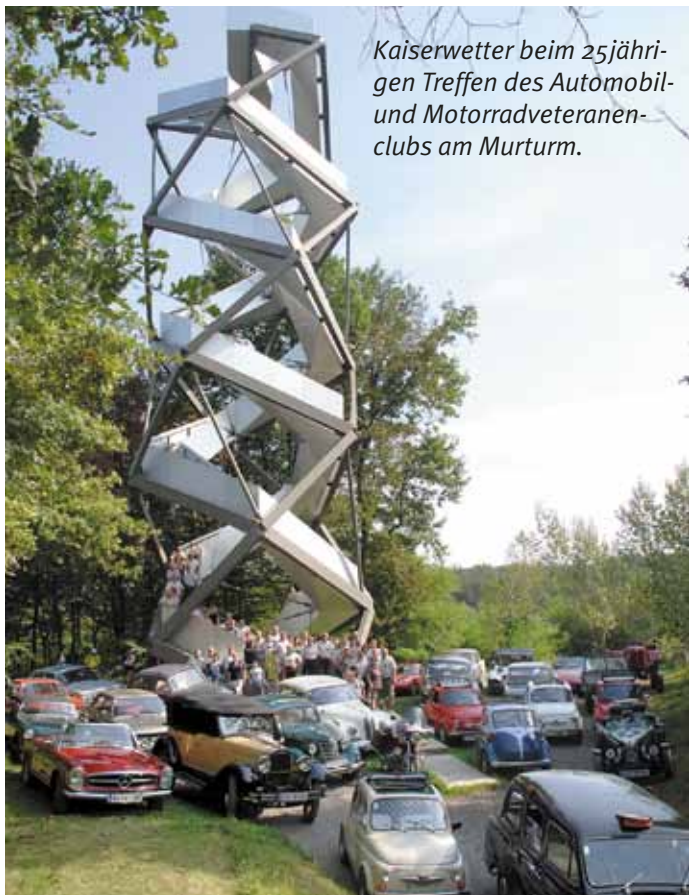
Kaiserwetter beim 25jährigen Treffen des Automobil- und Motorradveteranenclubs am Murturm.

A m Sonntag, dem 11. September 2016 trafen sich die Mitglieder des Ersten Automobil- und Motorradveteranenclubs des Thermengebietes Radkersburg im Gasthaus Röck zum Frühstücksbuffet, um einen Tag lang das 25jährige Bestehen des Clubs zu feiern.