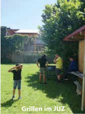
Grillen im JUZ