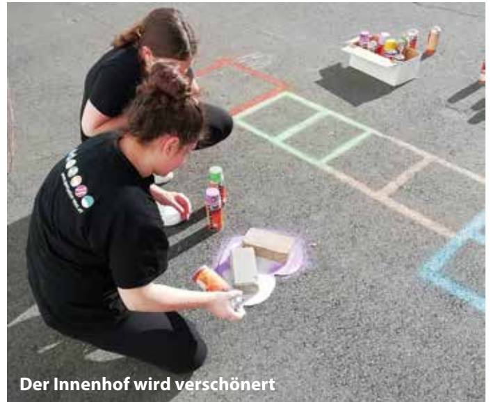
Der Innenhof wird verschönert