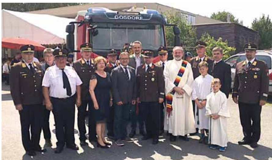
Ehrengäste bei der Segnung des HLF 1 der Freiwilligen Feuerwehr Gosdorf beim Bereichsfeuerwehrtag.