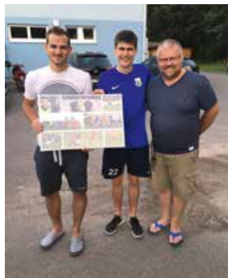
Dank an Benjamin Kreiner