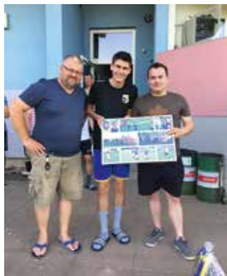
Dank an Alexander Mlinaric