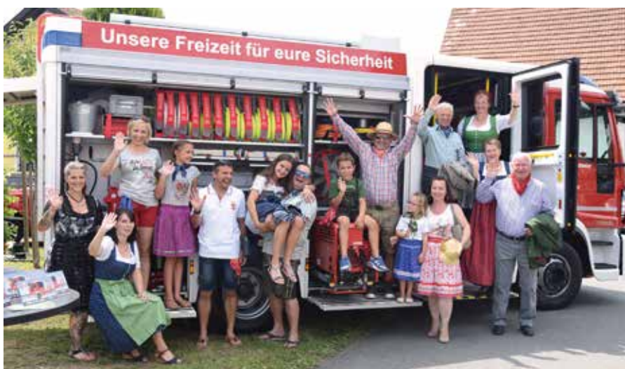
Die Modelle der Modeschau von Trachten-Trummer