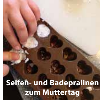
Seifen- und Badepralinen zum Muttertag