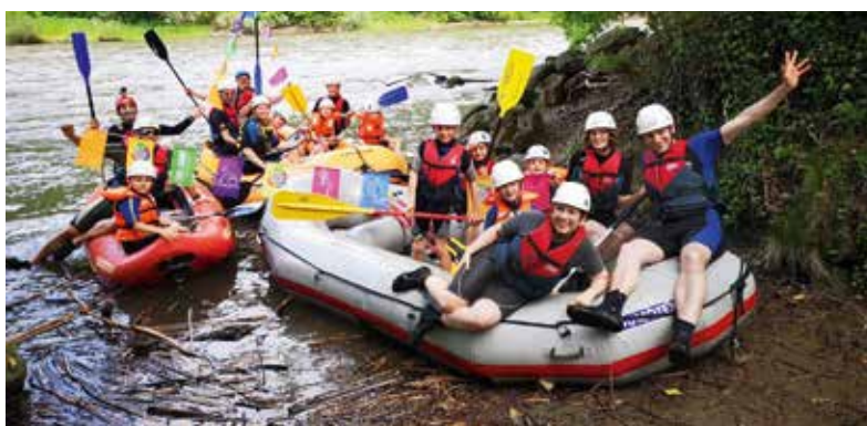
Text und Fotos: Martina Frohne