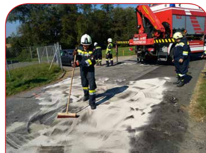
Ölbindearbeit nach einer Kollision eines PKW's mit einem Schienenfahrzeug