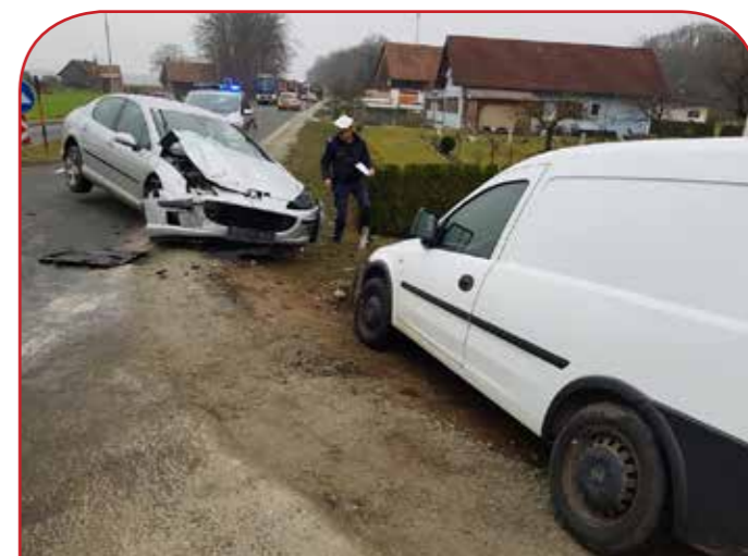
Kollision von zwei PKW's auf der L 208