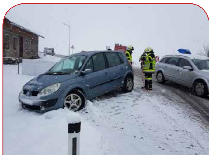
Fahrzeugbergung nach einem Verkehrsunfall auf Schneefahrbahn