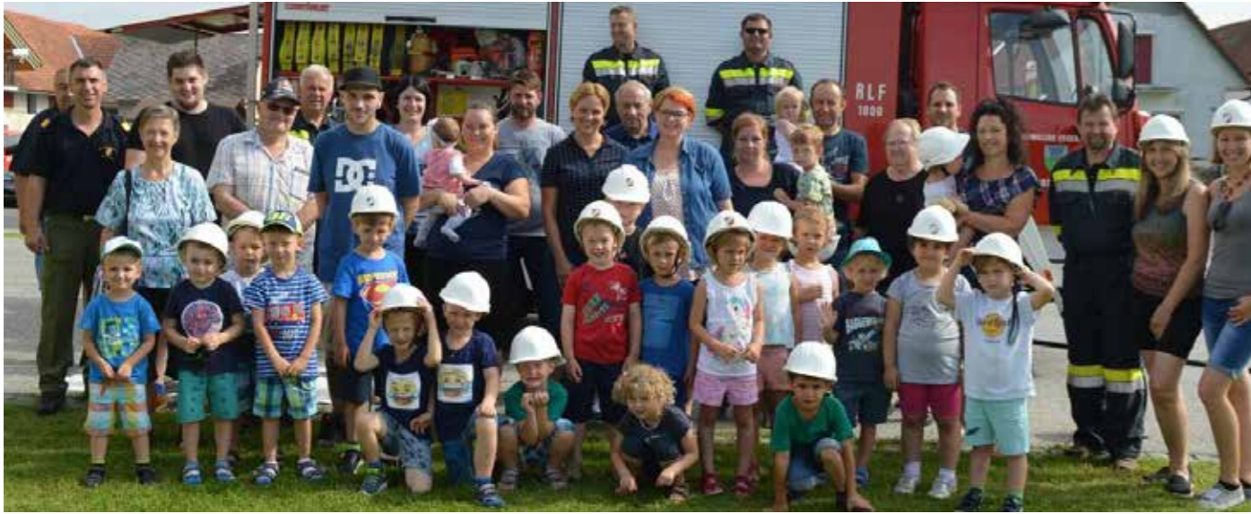
Der Kindergarten Gosdorf war zu Gast bei der FF Gosdorf. Nach einer kurzen Besichtigung des Feuerwehrhauses konnten es die Kinder kaum erwarten den Fuhrpark unter die Lupe zu nehmen. Natürlich durften die Kids dann auch selbst einen kleinen Brand löschen.