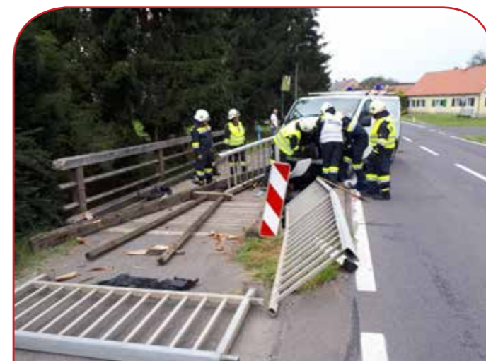
Klein LKW ramnte Brückenländer auf der B 69