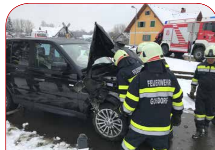
Verkehrsunfall mit einem Schienenfahrzeug