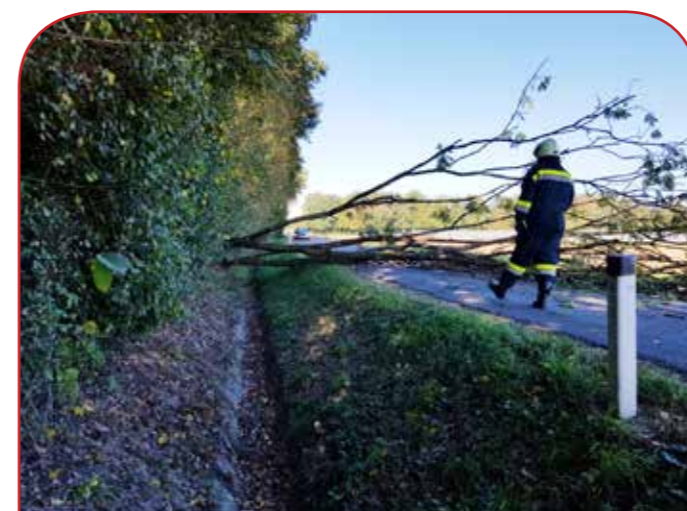
Beseitigung zahlreicher Sturmschäden im gesamten Löschgebiet