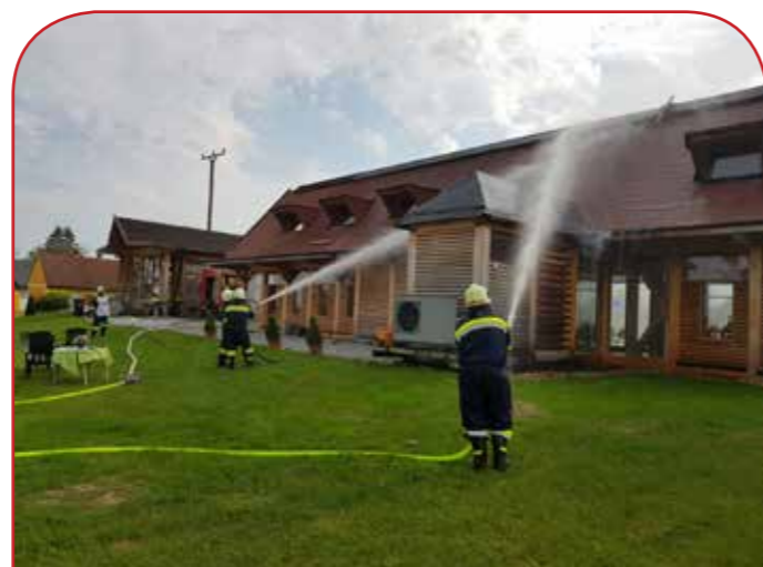
Dachstuhlbrand durch Flämmarbeiten