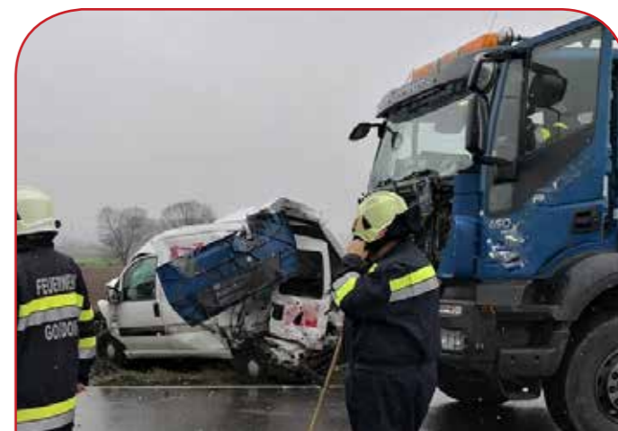
Verkehrsunfall auf der B 69 mit Beteiligung von zwei LKWs und 400 l Dieselaustritt