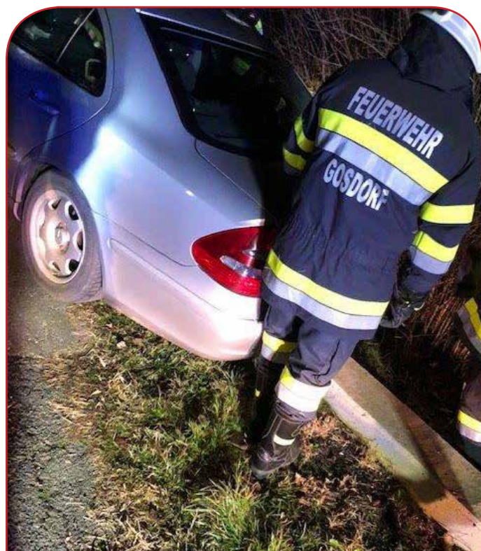
Fahrzeugbergung eines PKW's an der Staumauer des Saßbaches

Im eigenen Löschbereich hatte die Feuerwehr keinen Brandeinsatz abuarbeiten, aber wir wurden zu zwei Bränden nach Ratschendorf gerufen. Trotz des dichten Wassernetzes der Gemeinde rückten wird ganzjährig zu Wassertransporten im gesamten Löschbereich aus.