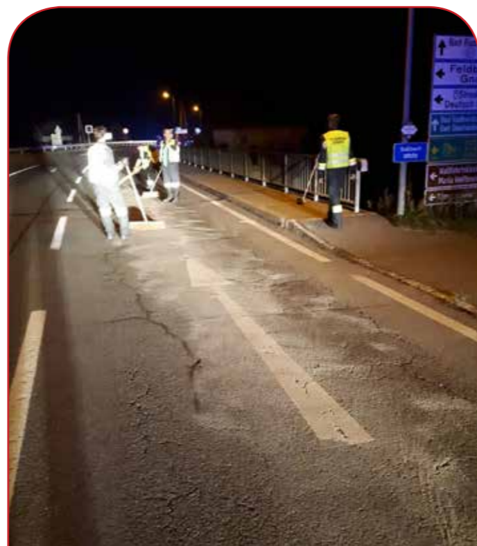
Ölbinden nach einem Verkehrsunfall auf der B69