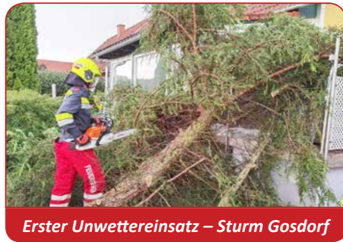
Erster Unwettereinsatz – Sturm Gosdorf

Was GUTES tun! Die FF Gosdorf konnte aufgrund von Corona keine Veranstaltungen durchführen, deshalb bitte wir Sie/Dich um eine Spende für die FF Gosdorf! Wir bitten Sie/Dich, die Spende auf das Konto der Freiwilligen Feuerwehr Gosdorf bei der RAIBA Mureck zu überweisen: IBAN: AT7438370000 0600 1853 BIC: RZSTAT 2G370 Nicht vergessen, Spenden an die Feuerwehr sind steuerlich absetzbar!