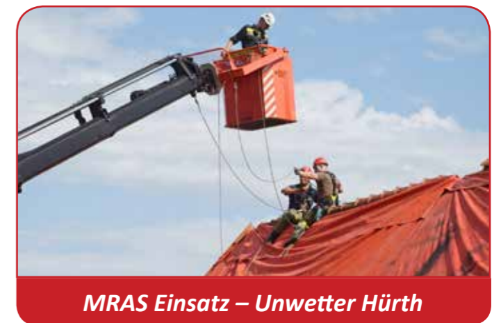
MRAS Einsatz – Unwetter Hürth