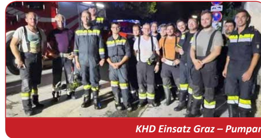
KHD Einsatz Graz – Pumparbeiten