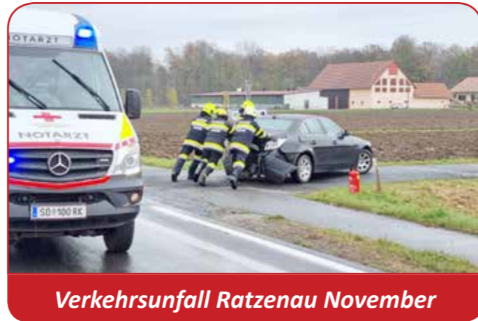
Verkehrsunfall Ratzenau November