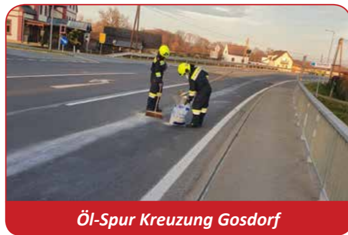
Öl-Spur Kreuzung Gosdorf