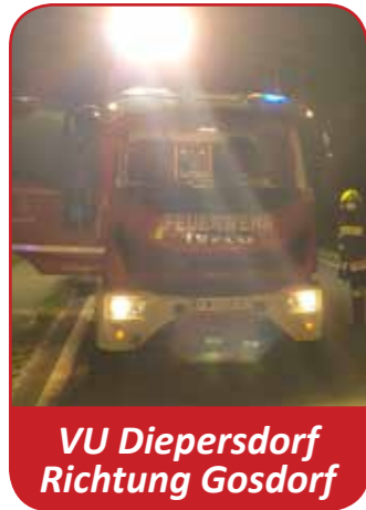
VU Diepersdorf Richtung Gosdorf