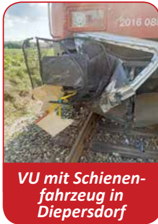
VU mit Schienenfahrzeug in Diepersdorf