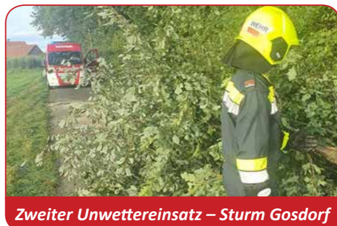
Zweiter Unwettereinsatz – Sturm Gosdorf

Was GUTES tun! Die FF Gosdorf konnte aufgrund von Corona keine Veranstaltungen durchführen, deshalb bitte wir Sie/Dich um eine Spende für die FF Gosdorf! Wir bitten Sie/Dich, die Spende auf das Konto der Freiwilligen Feuerwehr Gosdorf bei der RAIBA Mureck zu überweisen: IBAN: AT7438370000 0600 1853 BIC: RZSTAT 2G370 Nicht vergessen, Spenden an die Feuerwehr sind steuerlich absetzbar!