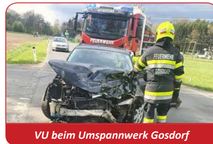
VU beim Umspannwerk Gosdorf