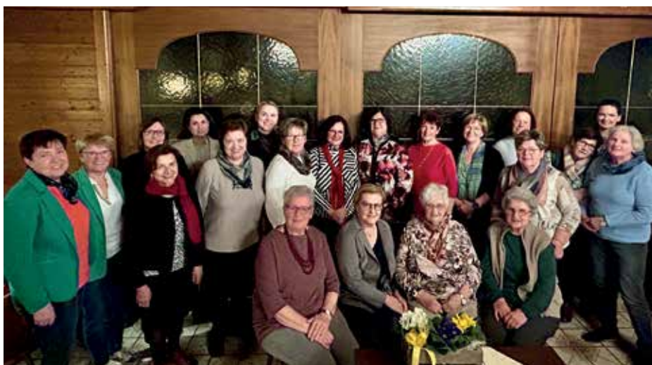
Gruppenfoto VP Frauen Ortsgruppe Eichfeld